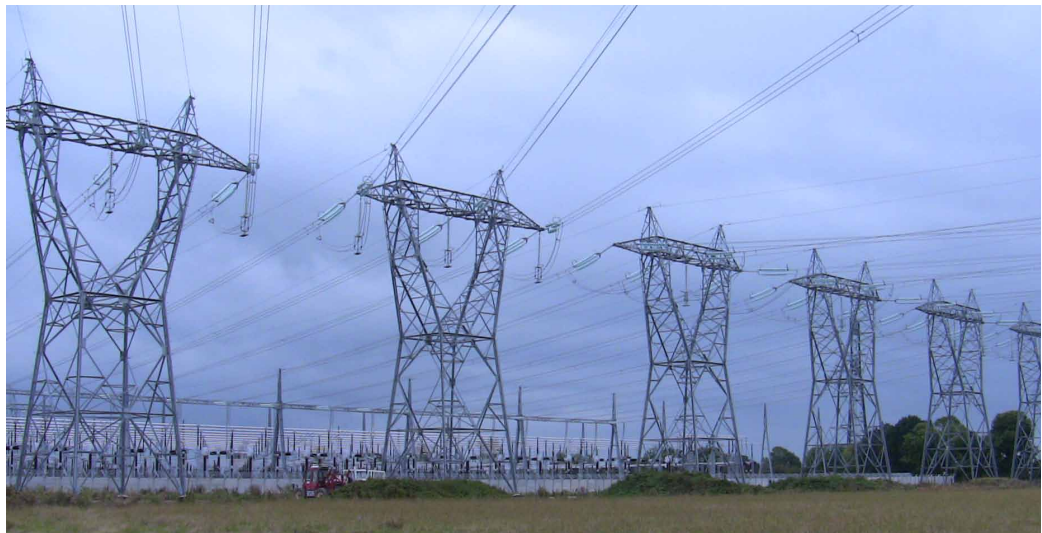
Poste de Taute, Saint-Sebastien-de-Raids (50)

(1) Comité de Réflexion, d'Information et de Lutte Anti-Nucléaire